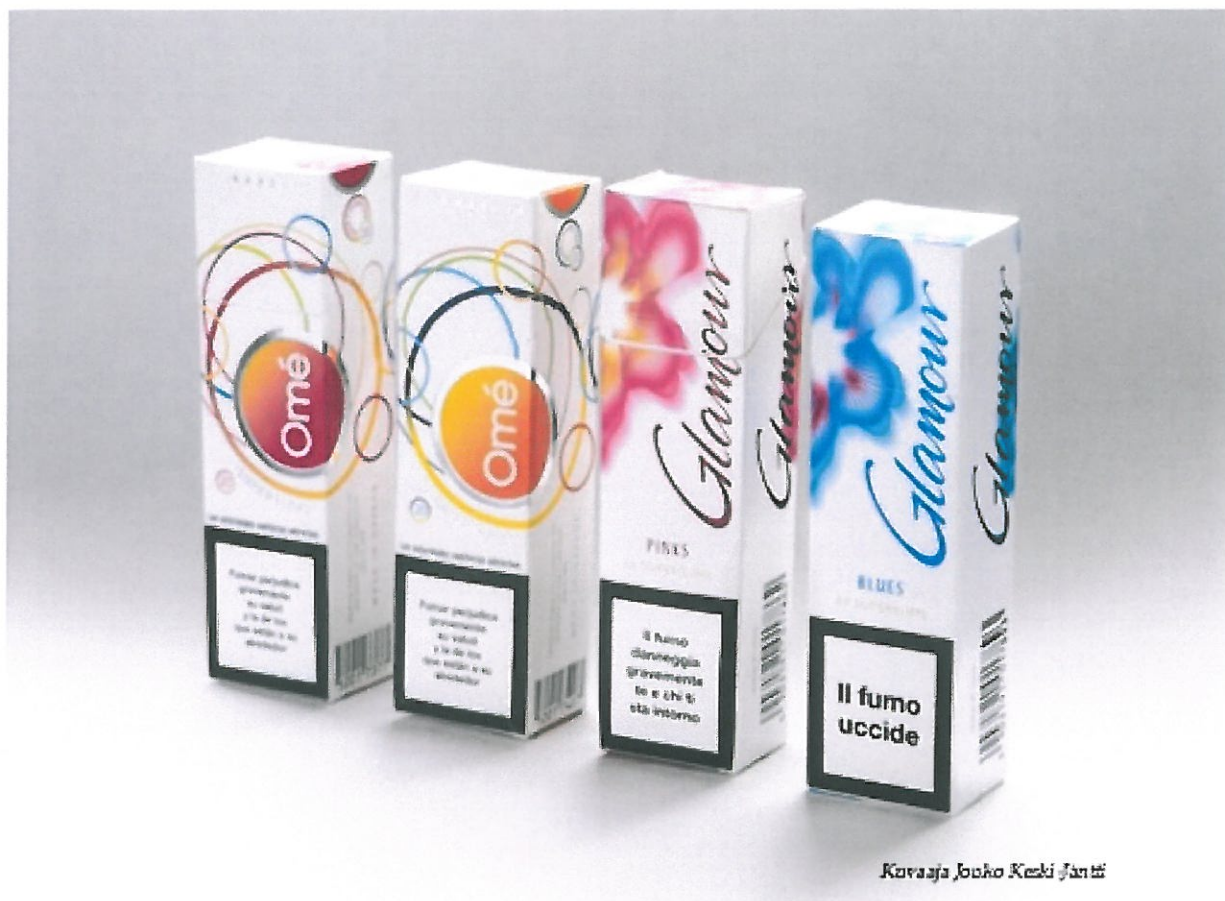
Kuvaaja Jouko Keski-jantti